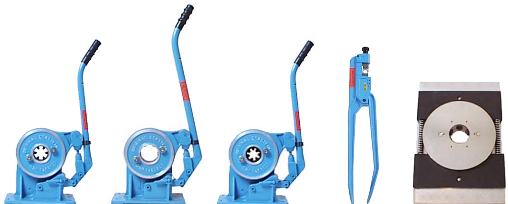
Handhebelschlauchpressen Typ UPS & PWZ

Das Presswerkzeug PW 4-8 ist eine kleine und preiswerte Alternative für Werkstätten, die nur selten eine Niederdruckschlauchpresse benötigen. Durch das Einspannen und Zusammendrehen in einem Schraubstock erfolgt eine gleichmäßige 6-Punkt-Verpressung.